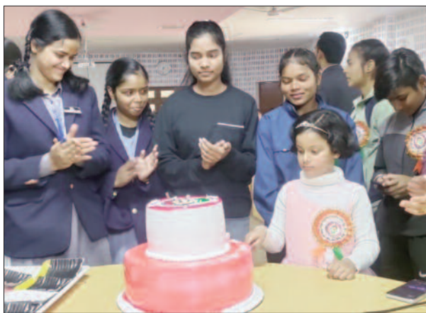
समरहणालय में केक काटती स्कूली बच्चियां

राष्ट्रीय बालिका दिवस कार्यक्रम का आयोजन कलेक्ट्रेट सभागार में सांसद वीरेंद्र सिंह मस्त के अध्यक्षता में हुआ। इस कार्यक्रम में 5 नवजात बच्चियों का केक काटकर कन्या जन्मोत्सव मनाया गया। इनकी माताओं को बेबी क्रीट एवं सम्मान पत्र दिया गया। साथ ही जनपद के विभिन्न क्षेत्रों जैसे शिक्षा, खेल, साहसिक कार्य आदि के क्षेत्र में उत्कृष्ट कार्य करने वाली बालिकाओं को सांसद वीरेंद्र सिंह मस्त जी द्वारा सम्मान पत्र एवं