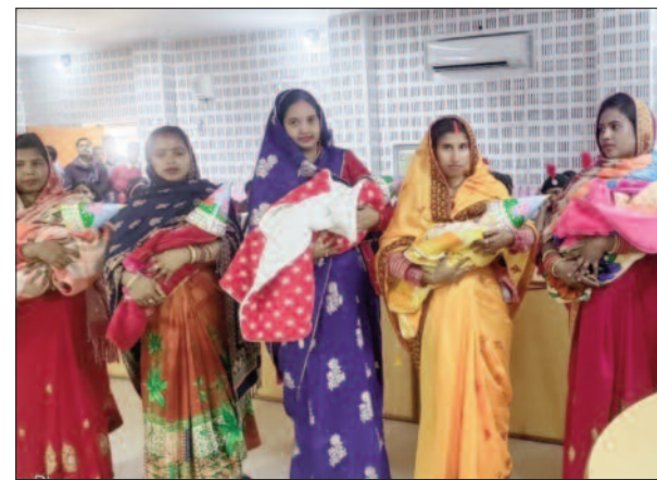
अपनी माताओं के साथ सम्मानित हुई नवजात बच्चियां

माननीय सांसद ने कहा कि बेटियां न केवल समाज के लिए बल्कि राष्ट्र के लिए भी आवश्यक हैं। आज के समय में बेटों और बेटों में कोई अंतर नहीं रह गया है। बेटियां हर क्षेत्र में अपना नाम रोशन कर रही हैं और देश का गौरव बढ़ा रही हैं। सरकार द्वारा बालिकाओं के लिए इस कार्यक्रम में संबोधित विभागों द्वारा चलाई जा रही विभिन्न योजनाओं की बेटों बचाओ बेटों पढ़ाओ एवं जानकारी भी दी गयी।