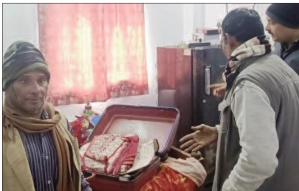
घटना के बाद जानकारी लेते पीड़ित व अन्य लोग

उनका आरा वाला मकान में ताला बंद था। इधर, जमीन संबंधी कुछ काम के चक्कर में वह परिवार के साथ गांव पर उठरे थे। इस बीच मंगलवार की सुबह करीब तीन बजे मोहल्ले के लोगों द्वारा उनके घर में