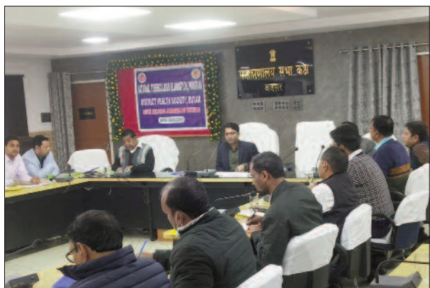
अधिकारियों के साथ बैठक करते जिलाधिकारी

स्कोली बच्चों को दें टीबी की जानकारी : जिला पदाधिकारी महोदय ने जिला शिक्षा पदाधिकारी बक्सर को निर्देश दिया कि 9वीं क्लास से ऊपर के छात्र-छात्राओं के बीच टीबी के संबंध में जानकारी उपलब्ध कराएं और सिविल सर्जन