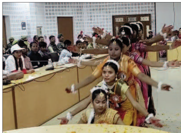
कार्यक्रम में नृत्य प्रस्तुत करती स्कूली छात्राएं

बेटों बचाओ बेटों पढ़ाओ लोगो लगा हुआ कप, टी-शर्ट एवं टोपी का वितरण किया गया। इस कार्यक्रम में बालिकाओं ने रंगारंग कार्यक्रम भी प्रस्तुत किया। साथ ही 50 बालिकाओं को सम्मान पत्र देकर सम्मानित किया गया।