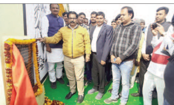
शिलापट का अनावरण करते डीडीसी