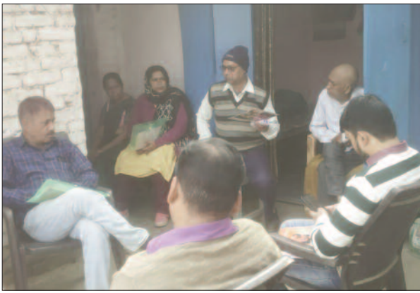
ग्रामीणों को जानकारी देते अधिकारी

थकान महसूस होना, पेट का बड़ जाना आदि इसके लक्षण के रूप में दिखाई देने लगते हैं। ऐसे व्यक्ति को तुरंत नजदीक के अस्पताल में जाकर अपनी जांच करवानी चाहिए। ठीक होने के बाद भी कुछ व्यक्ति के शरीर पर चकता या दाग होने लगता है। ऐसे व्यक्तियों को भी अस्पताल जाकर अपनी जांच करानी चाहिए। इस दौरान प्रभावित इलाकों के ग्रामीण चिकित्सक और जनप्रतिनिधित भी मौजूद रहे।