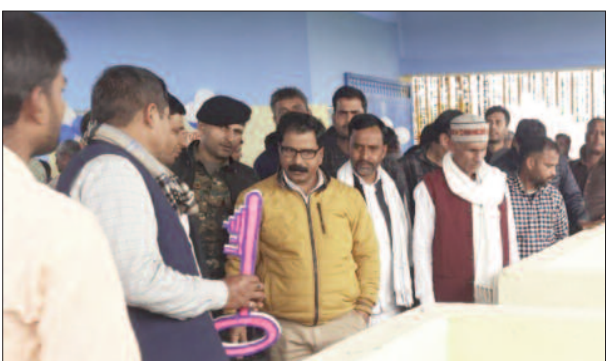
प्रोसेसिंग यूनिट का जायजा लेते डीडीसी व अन्य