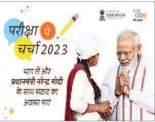
दी है। सभी सरकारी व निजी स्कूलों के अधिक से अधिक बच्चों को इस महत्वपूर्ण कार्यक्रम में शामिल कराने के लिए विभाग के अधिकारियों द्वारा प्रयास शुरू कर दिया गया है। प्रधानाध्यापकों को जारी किया

पर चर्चा कार्यक्रम में वर्ग 6 तथा इससे ऊपर के छात्रों के लिए होगा। पीएम मोदी उन्हें परीक्षा में बेहतर परिणाम लाने तथा टेंशन मुक्त रहने के की टिप्स देंगे। इस आयोजन को ले शिक्षा विभाग ने तैयारियां शुरू कर