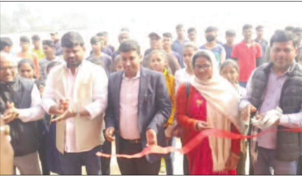
खेलकूद प्रतियोगिता का उद्घाटन करते विधायक व अन्य