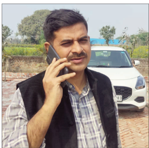
आशंका उत्पन्न न हो। भाजपा नेता ने यह भी कहा कि भारत एक स्वतंत्र और संप्रभु राष्ट्र है