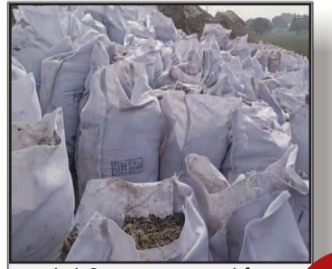
मानकों से खिलवाड़ : बक्सर-कोईलवर तटबंध की मरम्मत में रेत की जगह डाली जा रही है मिट्टी भरी बोरियां

प्रमुख खबरें : दिल्ली ■ पटना ■ बक्सर ■ शाहाबाद ■ मगध