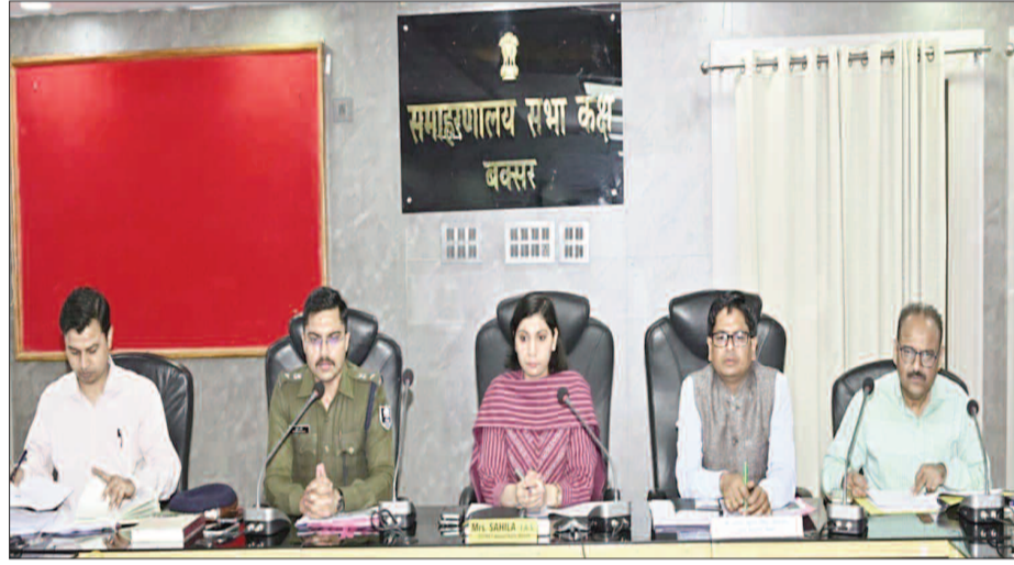
संवेदनशील मामलों में स्वयं रुचि लेकर त्वरित निष्पादन करने को कहा गया। नीलाम पत्र वाद की समीक्षा में प्रत्येक थाना क्षेत्र के बड़े बकायेदारों के विरुद्ध अभियान चलाकर बांड़ी वाद के अनुपालन का निर्देश दिया गया। अनुमंडल पदाधिकारी तथा अनुमंडल पुलिस पदाधिकारी बक्सर एवं डुमरांव को पाक्षिक बैठक कर नीलाम पत्र वादों की नियमित अनुश्रवण करने को कहा गया। साथ ही 15 दिनों के अंतराल पर बड़े बकायेदारों से वसूली के लिए विशेष अभियान चलाने का निर्देश दिया गया। सड़क सुरक्षा की समीक्षा के दौरान नगर परिषद बक्सर एवं डुमरांव क्षेत्र में नियमित रूप से लगने वाले यातायात जाम पर चिंता जताई गई। अनुमंडल पदाधिकारी, अनुमंडल पुलिस पदाधिकारी एवं कार्यपालक पदाधिकारियों को चिन्हित स्थलों पर क्विक रिस्पॉन्स टीम गठित कर प्रतिनिधित्व करने का निर्देश दिया गया। टीमों को माईकिंग कर नो-ट्रैकिंग जेन में खड़े वाहनों को हटाने तथा फुटपाथों दुकानदारों को निर्धारित वॉइज जेन में दुकान लगाने के लिए प्रेरित करने को कहा गया। विद्यालय वाहनों की बैठक आयोजित कर निर्धारित रूट एवं चिन्हित स्थलों पर ही बस रोकने का निर्देश दिया गया। नगर परिषद के कार्यपालक पदाधिकारियों को