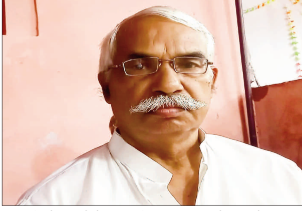
यह निर्णय दो परिवारों के लिए नई सुबह लेकर आया। गौरतलब है कि सरकार और विभिन्न सामाजिक संस्थाओं द्वारा अंगदान को लेकर लगातार जागरूकता अभियान चलाए जा रहे हैं, बावजूद इसके धार्मिक मान्यताओं और परंपरागत धारणाओं के कारण आज भी कई लोग इससे हिचकिचाते हैं। ऐसे में एक पारंपरिक परिवार द्वारा आगे बढ़कर नेत्रदान

डुमरांव के समाजसेवी ट्रांसपोर्ट व्यवसायी की अंतिम इच्छा का परिजनों ने रखा मान, पटना में हुआ नेत्रदान