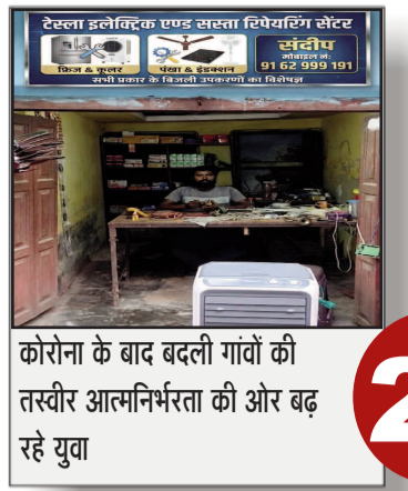
कोरोना के बाद बदली गांवों की तस्वीर आत्मनिर्भरता की ओर बढ़ रहे युवा