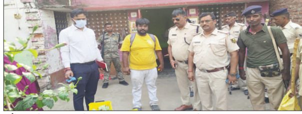
और आरोपी फरार हो गए।

गई। बताया जा रहा है कि आरोपित पिता-पुत्र घर पहुंचे और दरवाजा खटखटाते लगे। जैसे ही किशोरी ने दरवाजा खोला, एक युवक ने उस पर ताबड़तोड़ फायरिंग कर दी। गोली लगते ही किशोरी मौत पर गिर पड़ी और उसकी मौत हो गई। घटना के बाद गांव में अफरा-तफरी मच गई