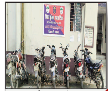
छह बाइक, तीन राज्य और एक मास्टरमाइंड: सिमरी में अंतरराज्यीय बाइक चोर गिरोह का भंडाफोड़

प्रमुख खबरें : दिल्ली ■ पटना ■ बक्सर ■ शाहाबाद ■ मगध