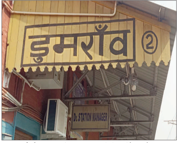
केटी न्यूज/डुमरांव दानापुर मंडल के बक्सर स्टेशन पर रेलवे द्वारा मरम्मत और तकनीकी कार्य के चलते 26 व 27 अप्रैल को ट्रेफिक तथा ओएचई (ओवरहेड इलेक्ट्रिक) ब्लॉक

■ ब्रिज मरम्मत और ओएचई कार्य के कारण 26-27 अप्रैल को देरी, री-शेड्यूलिंग व नियंत्रण, यात्रियों को पहले जानचे की सलाह