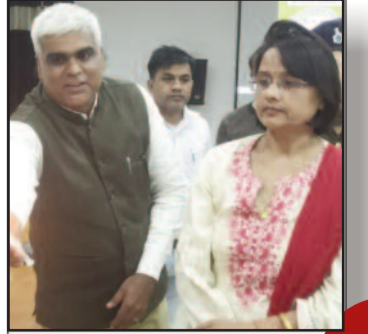
लैंगिक हिंसा और भेदभाव के खिलाफ चुप्पी तोड़ें, उदाएं आवाज: डीडीसी