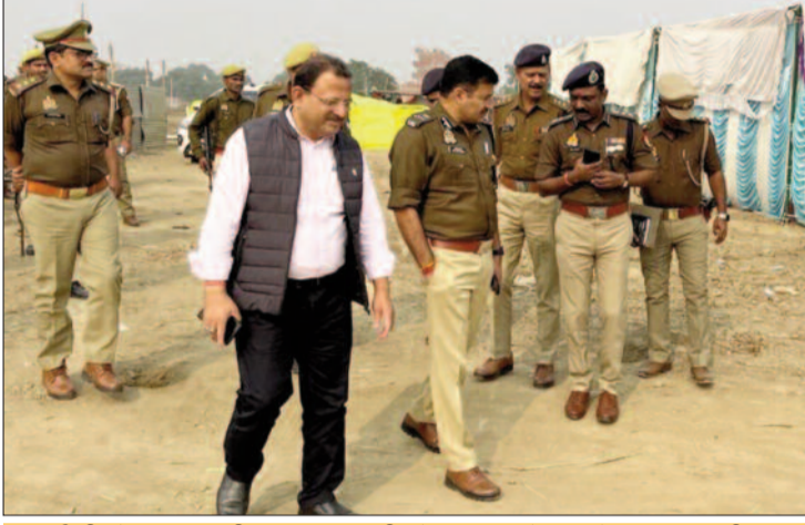
आईजी के साथ डीएम व एसपी ने किया मेला क्षेत्र का निरीक्षण

16 सेक्टर में बंटा ददरी मेला व स्नान क्षेत्र: भृगु मुनि के शिष्य ददरी मुनि के नाम पर लगने वाले ऐतिहासिक ददरी मेला तथा कार्तिक पूर्णिमा स्नान के मद्देनजर 16 सेक्टर और सात जून में विभाजित किया गया है। जिसके लिए पुलिस विभाग द्वारा करीब एक हजार अधिकारियों व कर्मचारियों को तैनात किया गया है। जिसमें 16 मजिस्ट्रेट व 16 सेक्टर पुलिस अधिकारी तैनात किए गए हैं। इसके अलावा पीएसी, एनडीआरएफ व