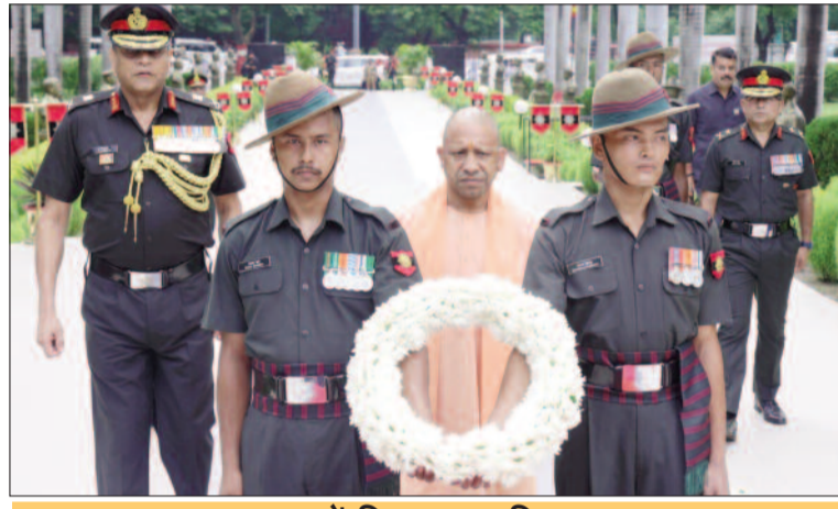
इन्हें किया सम्मानित

मुख्यमंत्री योगी आदित्यनाथ ने कहा कि कारगिल युद्ध भारत पर थोपा गया था। छद्म रूप से पाकिस्तान ने कश्मीर में घुसपैठ करके भारत पर युद्ध थोपने का कार्य किया था। किन्तु युद्ध का परिणाम क्या होगा यह हमारे बहादुर जवानों ने तय किया। उस समय हमारी सेना के वीर जवानों के सामने विपरीत परिस्थितियां थीं, लेकिन हमारे बहादुर जवानों के सामने कोई दुश्मन टिक नहीं पाया। उन्होंने कहा कि कारगिल युद्ध के दौरान भारतीय जवानों के अदम्य शौर्य और साहस का लोहा दुनिया ने माना। मुख्यमंत्री योगी आदित्यनाथ ने शुक्रवार को सेंट्रल कमांड, कैंट के सूर्या सभागार में कारगिल विजय दिवस की 25वीं वर्षगांठ पर आयोजित 'रजत जयंती समारोह' को संबोधित किया। इस दौरान उन्होंने कारगिल विजय दिवस की बधाई देते हुए कहा कि जिन वीर नारियों और परिवारों ने कारगिल युद्ध में अपने परिवार के सदस्यों को खोया है, आज उन्हें सम्मानित कर गौरवान्वित महसूस कर रहा हूँ। सीएम योगी ने कहा कि दुनिया के अंदर भारत की