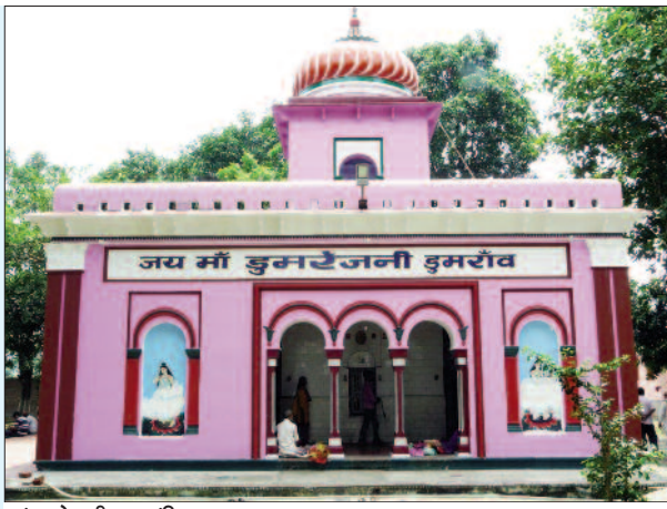
मां डुमरेजनी का मंदिर

लोग यहां उमड़ते लेकर आते हैं और जब उनकी उमड़ें पूरी होती है, तो एक बार मत्था टेकने जरूर आते हैं। कहा जाता है कि यहां सभी की उमड़ें पूरी होती है। उमड़ियों की यह कहानी पांच सदी पुरानी है। हम बात कर रहे हैं नगर देवी मां डुमरेजनी की महिमा तथा मांदर सं जुड़ा मान्यताओं का। नगर