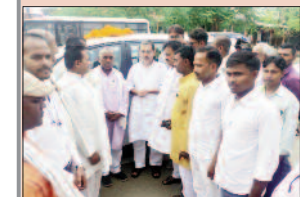
अरवल। जिला के परसारी इंग्लिश बाजार में जनता दल यूनाइटेड संसदीय बोर्ड राष्ट्रीय अध्यक्ष सह पूर्व मंत्री भारत सरकार उपेंद्र कुशवाहा का स्वागत किया गया। इस दौरान महात्मा का स्वागत किया गया।

20 अक्टूबर के पहले कार्यकर्ता पूरा करें सदस्यता अभियान : उपेंद्र कुशवाहा