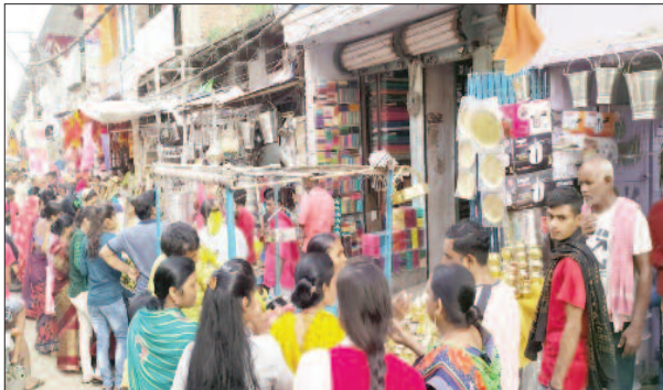
बाजार में खरीददारी करते लोग

शारदीय नवरात्र सोमवार से शुरू हो रहा है। शक्ति के नौ दिनों में भक्ति के नौ अलग अलग रूपों की पूजा की तैयारी में हिंदू समाज पूर्व संध्या से ही जुट गया है। पूर्व संध्या पर जिलेभर के बाजारों में इसका असर भी देखा गया। बाजार खुलने के साथ ही खरीददारों की भीड़ उमड़ गई थी। लोग मां दुर्गा की मूर्तियों, कैलेंडर, फल, मेवा, चुंदरी आदि सामानों के साथ ही पूजा की अन्य सामग्रियों, धूप, दीप, रूई, अंगवती, नैवेद्य आदि की खरीददारी कर रहे थे। पूजा सामग्री, किराना दुकानों तथा फल की दुकानों पर पूरे दिन लोगों की भीड़