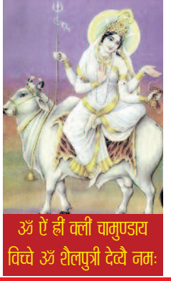
ॐ ऐं ह्रीं क्लीं चामुण्डाय विच्चे ॐ शैलपुत्री देव्यै नमः