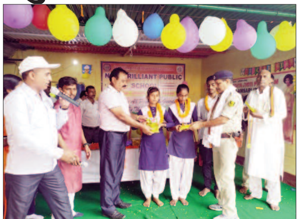
छात्राओं का सम्मानित करते अतिथि