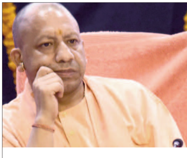
नया माध्यम बनने जा रहा है। मुख्यमंत्री ने प्लांट की स्थापना के लिए प्रधानमंत्री नरेन्द्र मोदी और केंद्रीय पेट्रोलियम मंत्री हरदीप पुरी का हृदय से आभार व्यक्त किया। मुख्यमंत्री ने बताया कि प्रदेश के

मुख्यमंत्री ने कहा कि आर्थिक रूप से विपन्न क्षेत्र में सीबीजी प्लांट पर्यावरण की रक्षा, अनदनादा किसानों की आमदनी, युवाओं को रोजगार और नये उद्यम स्थापित करने का