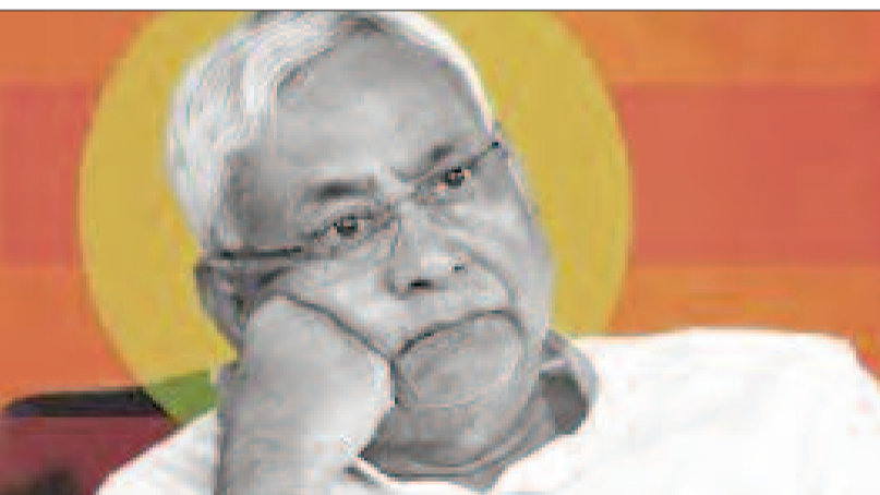
तेजस्वी ने जितन राम मांझी को दिया सीएम बनने का ऑफर!

उधर, बीजेपी दफ्तर में पार्टी के प्रदेश कोर कमिटी की बैठक चल रही है। इस बैठक में बिहार बीजेपी के प्रभारी भूपेश बघेल, प्रदेश अध्यक्ष सम्राट चौधरी, सुशील मोदी, विजय कुमार सिन्हा समेत दूसरे प्रमुख नेता मौजूद हैं। पार्टी सूत्रों के मुताबिक इस बैठक में नीतीश कुमार के साथ बनने जा रही नयी सरकार के खाके पर विचार विमर्श किया जा रहा है। वैसे बीजेपी के किसी नेता ने