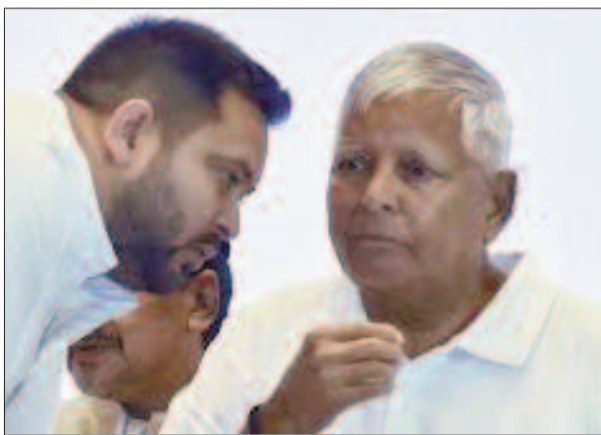
किया है कि वह अभी इंतजार करेगा। इस बैठक में ये तय हुआ है कि लालू जी जो फैसला लेंगे उसी के अनुसार सारे लोग काम करेंगे। मनोज झा ने दावा किया कि राजद मौजूदा सरकार को गिराने की कोशिश नहीं करेगी। राजद के सांसद ने कहा जिस सरकार की बुनियाद में

मनोज झा ने कहा कि राजद विधायकों की बैठक में नीतीश कुमार के एनडीए में जाने पर भी चर्चा हुई है। पार्टी के विधायकों से लेकर राष्ट्रीय अध्यक्ष लालू प्रसाद यादव और तेजस्वी यादव ने भी इस मुद्दे पर अपनी राय रखी है। राजद ने तय