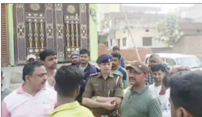
घटना के बाद पूछताछ को पहुंचे थानाध्यक्ष व अन्य