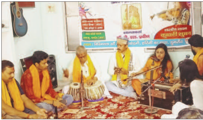
कार्यक्रम में संगीत प्रस्तुत करती कलाकार