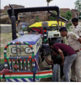
बालू माफियाओं में हड़कंप मच गया है। बताया जा रहा है कि इस माह में पुलिस ने अवैध बालू लदे तीसरे वाहन को जब्त की है।