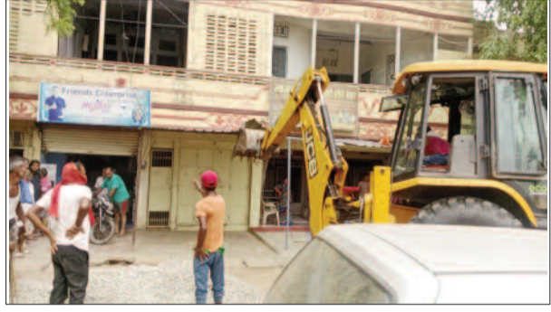
ब्रह्मपुर चौरस्ता पर अतिक्रमण हटाने की कर्मियों

♦ गुप्त सूचना पर पुलिस को प्रताप सागर के पास मिली सफलता, चालक से पूछताछ के आधार पर तस्कर की पहचान में जुटी पुलिस