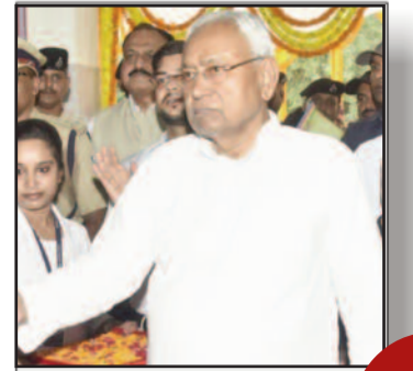
सीएम ने बांका सदर अस्पताल के नए भवन का किया उद्घाटन