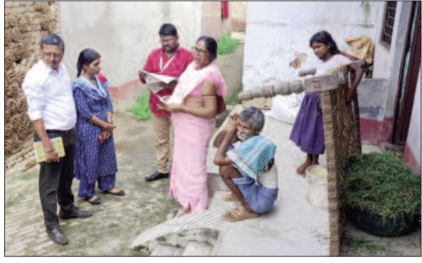
द्वारा अनुश्रवण तथा निरीक्षण किया जा रहा है। इस क्रम में स्वास्थ्य विभाग के

फाइलेरिया राज्य सलाहकार ने एमडीए अभियान का किया निरीक्षण