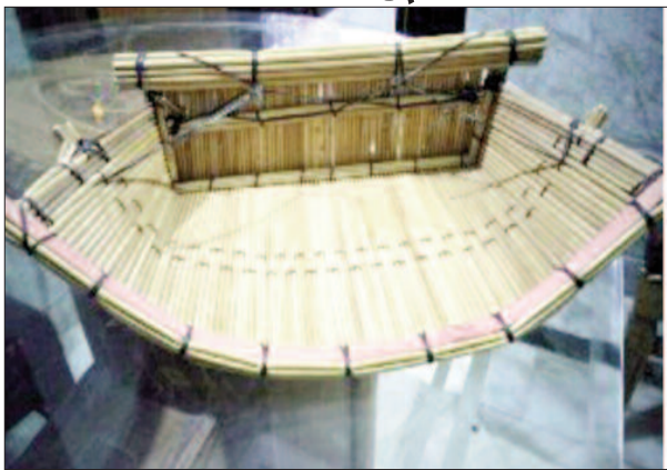
सूप बजा कर दरिद्र भगाने की परंपरा को जोड़ कर देखा जाता है। कहीं

धन की देवी लक्ष्मी की पूजा दीपावली के बाद त्योहारों की श्रृंखला शुरू हो जाती है। इस कड़ी में दरिद्र (दलित) खदेड़ने की सदियों पुरानी परंपरा भी है। इस अवसर पर घर की महिलाएं सूप पीट घर से दरिद्र को खदेड़ती हैं। बांस से बनी सूप को हंसिया आदी लोहे के किसी औजार से पीट कर दरिद्र खदेड़ा जाता है। इस दौरान महिलाएं कहती हैं कि ईश्वर परसे, दलितर भागे" यानी कि 'ईश्वर आकर बैठें और दरिद्र भागे।