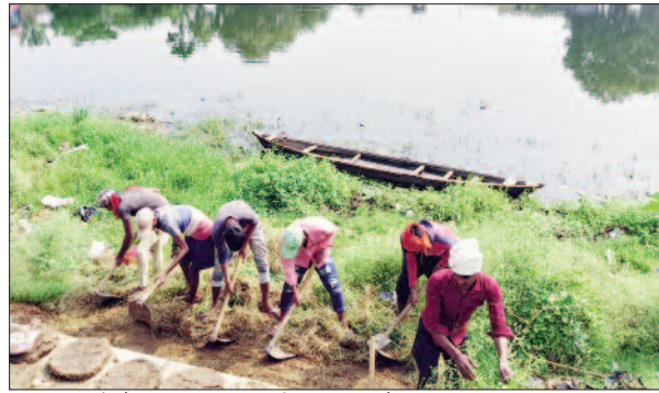
छठ पूजा को लेकर नया तालाब की सफाई करते मजदूर।