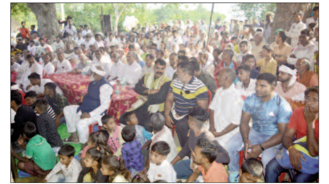
कुश्ती का मुकाबला देखने के लिए उमड़ी लोगों की भीड़।