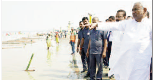
कलेक्ट्रेट घाट का जायजा लिया। निरीक्षण के दौरान मौजूद

मुख्यमंत्री नीतीश कुमार ने महापर्व छठ की तैयारियों को लेकर बुधवार को सड़क मार्ग से विभिन्न छठ घाटों का निरीक्षण किया। इस दौरान उन्होंने जेपी गंगा पथ होते हुए दीघा के पाटीपुल घाट, जेपी सेतु घाट, 93 घाट, 83 घाट, बालूपर घाट, कुर्जी घाट, एलसीटी घाट, पहलवान घाट, अंटो घाट और