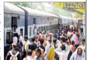
डुमरांव। लोक आस्था के महापर्व छठ को ले प्रवासी अपने घर आने लगे हैं। जिस कारण ट्रेनों में भीड़ बढ़ गई है। हालांकि रेलवे द्वारा छठ को देखते हुए कई स्पेशल ट्रेनें चलाई जा रही हैं। लेकिन यात्रियों के मुकाबले ट्रेनें कम पड़ रही हैं। लिहाजा भीड़ बढ़ गई है। आलम ट्रेन पर चढ़ने के लिए उमड़ी भीड़