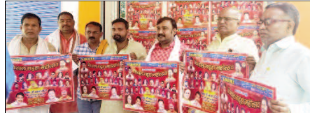
पोस्टर अनावरित करते कलाकार व मंच के सदस्य।

दो दिवसीय महोत्सव के लिए गड़हा विकास मंच ने जारी किया पोस्टर