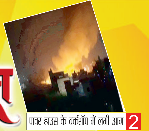
पावर हाउस के वर्कशॉप में लगी आग 2

प्रमुख खबरें : पटना ■ भोजपुर ■ बक्सर ■ रोहतास ■ पूर्वांचल ■ विविध ■ खेल ■ आर्थिक