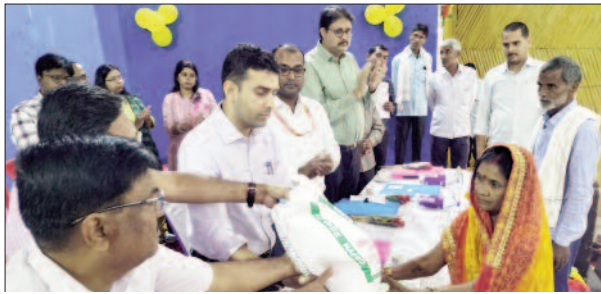
किसानों को बीज देने डीएम व अन्य अधिकारी मृदा स्वास्थ्य कार्ड के अनुसार उर्वरक का करें प्रयोग