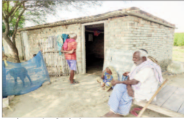
घटना के बाद मर्माहत परिवार के लोग।

परिजन रात को ही पुलिस को सूचना देते हुये उसे मऊ ले गए। हालत गंभीर देख चिकित्सकों ने उसे वाराणसी के लिए रेफर कर दिया जहां उसकी हालत नाजुक बनी हुई है। विस्तर व चादर खून से सने पड़े दिखाई पड़े रहे थे। घटना क्यों हुई