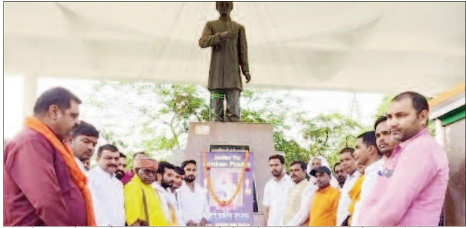
बलिया के सरजू पांडेय पार्क में बुधवार को ब्राह्मण रक्षा दल के नेतृत्व में आयोजित श्रद्धांजलि सभा में शामिल लोग।