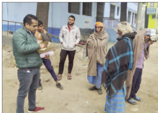
मृतक के परिजनों से पूछताछ करते अधिकारी।