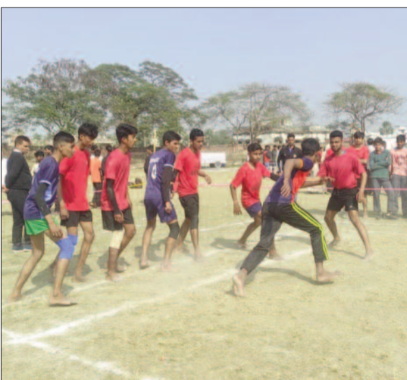
दश वार्षिक खेल कार्यक्रम के दौरान कबड्डी प्रतियोगिता में हिस्सा लेते खिलाड़ी।

प्रखंड एवं उप विजेता मखदुमपुर प्रखंड रहा कबड्डी प्रतियोगिता के अंडर 17 (बालक वर्ग) में जहानाबाद प्रखंड विजेता एवं घोसी प्रखंड उप विजेता है। कबड्डी के अंडर 19 (बालक वर्ग) में हुलासगंज प्रखंड विजेता एवं काको प्रखंड उप विजेता है। खो-खो के अंडर 14 (बालक वर्ग) में मध्य विद्यालय, बौरी, हुलासगंज प्रखंड विजेता एवं मध्य विद्यालय, सवलपुर, मखदुमपुर प्रखंड उप विजेता है। खो-खो के अंडर 14 (बालिका वर्ग) में मध्य विद्यालय, सारपुर, मखदुमपुर प्रखंड विजेता एवं मानस विद्यालय, बभना, जहानाबाद प्रखंड उप विजेता है।