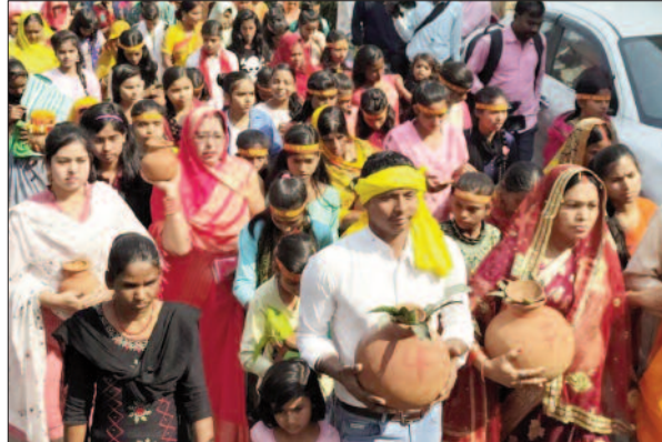
कलशयात्रा में शामिल श्रद्धालु

की श्रीमद्भागवत कथा की अमृत वर्षा होगी। सात दिवसीय महायज्ञ को लेकर यज्ञ स्थल से वैदिक मंत्रोच्चारण के साथ भव्य कलशयात्रा निकली तो जगह-जगह ग्रामीणों ने अपने छतों से पुष्प वर्षा कर कलशयात्रा का स्वागत किया। भक्ति जयकारों से पूरा इलाका गुंजमान बना रहा। सात दिवसीय महायज्ञ के आयोजन में संतों और दूर-दूर से आने वाले अतिथियों के लिए रहने और खाने की व्यवस्था