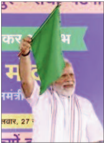
बंगलुरु वंदे भारत एक्सप्रेस और रांची-पटना वंदे भारत एक्सप्रेस शामिल हैं।

भारतीय रेलवे रेलवे के इतिहास में ऐसा पहली बार है, जब देश को एक साथ पांच ट्रेनों की सौगात मिली है। प्रधानमंत्री नरेंद्र मोदी ने मंगलवार को एक साथ पांच वंदे भारत एक्सप्रेस ट्रेनों को हरी झंडी दिखाकर रवाना किया। प्रधानमंत्री नरेंद्र मोदी मध्य प्रदेश के वीर पर हैं। इस दौरान उन्होंने भोपाल के कमलापति रेलवे स्टेशन से एक साथ 5 वंदे भारत ट्रेनों को हरी झंडी दिखाई। इनमें रानी कमलापति-जबलपुर वंदे भारत एक्सप्रेस, खजुराहो-भोपाल-इंदौर वंदे भारत एक्सप्रेस, मडगांव-मुंबई वंदे भारत एक्सप्रेस, धारवाड़-