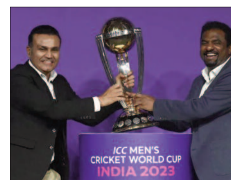
बंगलुरु, मुंबई और कोलकाता में मुकाबले हैं। हैदराबाद के अलावा गुवाहाटी और तिरुवनंतपुरम 29 सितंबर से 3 अक्टूबर तक अभ्यास मैचों की मेजबानी करेंगे।

भारत में इस साल अक्टूबर-नवंबर में होने वाले विश्व कप का शेड्यूल जारी कर दिया गया है। मुंबई में मंगलवार (27 जून) को एक कार्यक्रम में मैचों की आधिकारिक जानकारी दी गई। भारतीय टीम विश्व कप में अपना पहला मैच आठ अक्टूबर को ऑस्ट्रेलिया में खेलेगी। यह मुकाबला चेन्नई के एमए चिदंबरम स्टेडियम में खेला जाएगा। वहीं, भारत का ग्रुप राउंड में पाकिस्तान से 15 अक्टूबर को महामुकाबला होगा। यह मैच अहमदाबाद के नरेंद्र मोदी स्टेडियम में खेला जाएगा। विश्व कप के मैच भारत के 10 शहरों में खेले जाएंगे। हैदराबाद, अहमदाबाद, धर्मशाला, दिल्ली, चेन्नई, लखनऊ, पुणे,