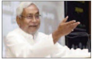
माना जाता रहा है। 1996 में कम सीट होने के बावजूद हरिकृष्णन सुरजीत ने संयुक्त मोर्चा की सरकार बनाने में बड़ी भूमिका निभाई। 1989 में राष्ट्रीय मोर्चा के कनिश्चन रहे वीपी सिंह चुनाव के बाद प्रधानमंत्री बन गए। गठबंधन राजनीति के खेल में बीजेपी भी उतरी और समाजवादी जॉर्ज को एनडीए का संयोजक बनाया गया। अटल सरकार में मंत्रियों के पोर्टफोलियो तय करने में जॉर्ज की राय अहम मानी जाती थी। हालांकि, गठबंधन पॉलिटिक्स में कई ऐसे संयोजक भी रहे, जो सिर्फ मीडिया की सुर्खियां बनकर रह गए।

नई दिल्ली। विपक्षी मोर्चे की उलझी पहलियों के बीच नीतीश कुमार के संयोजक बनने की तस्वीर लगभग साफ हो गई है। अब कयास लगाए जा रहे हैं कि नीतीश कुमार विपक्ष की ओर से पीएम पद के सबसे बड़े दावेदार भी हो सकते हैं। इतिहास में एक बार ऐसा हो भी चुका है। राष्ट्रीय मोर्चा नाम से बने गठबंधन में विश्वनाथ प्रताप सिंह संयोजक थे और इसी मोर्चे ने उनको प्रधानमंत्री भी बना दिया था। दरअसल पटना में हुई बैठक में सभी 15 दल नीतीश कुमार को संयोजक बनाने पर एकमत नजर आए। शिमला मीटिंग में इसकी औपचारिक घोषणा हो सकती है। 10-15 जुलाई के बीच शिमला में विपक्षी एकता की 2 दिवसीय बैठक प्रस्तावित है। गठबंधन की राजनीति में संयोजक का पद काफी महत्वपूर्ण