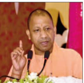
सख्त है और इसके लिए उन्होंने निर्देश भी जारी किए हैं। धार्मिक यात्राओं में हथियार प्रदर्शन को लेकर सीएम योगी ने कहा है कि धार्मिक यात्राओं व जुलूसों में अस्त्र-शस्त्र का प्रदर्शन नहीं होना चाहिए।

उत्तर प्रदेश के मुख्यमंत्री योगी आदित्यनाथ ने कहा कि आगामी दिनों में पवित्र श्रावण मास, परंपरागत कांवड़ यात्रा, नाग पंचमी, रक्षाबंधन, बकरीद, मुहर्रम आदि पर्व मनाए जाएंगे। प्रत्येक पर्व शांति और सौहार्द के बीच संपन्न हों, इसके लिए स्थानीय आवश्यकताओं के दृष्टिगत सभी प्रयास किए जाएंगे। कांवड़ शिविर के स्थान पहले से चिह्नित हों, ताकि आवागमन बाधित न हो। इसके साथ ही योगी सरकार धार्मिक यात्राओं में हथियार प्रदर्शन पर भी