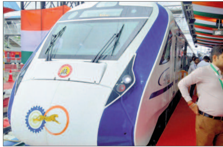
महाकालेश्वर, मांडू, महेश्वर, खजुराहो जैसे पर्यटन के अहम स्थानों से होकर गुजरेगी।