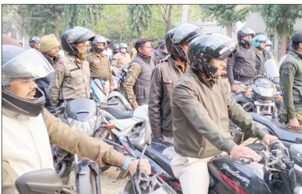
पल्लेग मार्च के लिए तैयार पुलिस जवान नगर पंचायत शांतिपूर्ण नगर निकाय चुनाव को भोजपुर पुलिस द्वारा

जिला मुख्यालय स्थित नगर निगम सहित कोइलवर और गड़हने