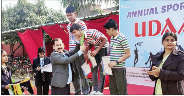
प्रतियोगिता के विजेताओं को सम्मानित करते शिक्षक