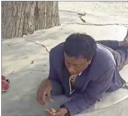
चबुतरे पर निदबल होकर नाशता करते विकित्सक

जिसमें वो योगदान करने आए एक परिचारी को खुलेआम गालियां दे रहे हैं और उसे जान से मारने तक की न सिर्फ धमकी दी, बल्कि ईट उठा उस पर वार करने का प्रयास भी किया। उस घटना के बाद एक और वीडियो है, जिसमें देखा जा सकता है कि वे अस्पताल परिसर के अंदर खुलेआम सिगरेट का पैकेट लिए व सिगरेट पी रहे हैं। जबकि स्वास्थ्य विभाग के नियमों के मुताबिक अस्पताल परिसर में धूम्रपान निषेध है। वहीं, वीडियो में वे कई संदेहास्पद हरकतें करते हुए नजर आ रहे हैं। जिसे देख कोई भी अंदरजा लगा सकता है कि वो या तो मानसिक रूप से बीमार हैं या फिर नशे की चोट में हैं।