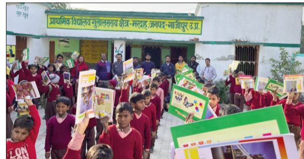
कार्यक्रम में शामिल स्कूली बच्चे