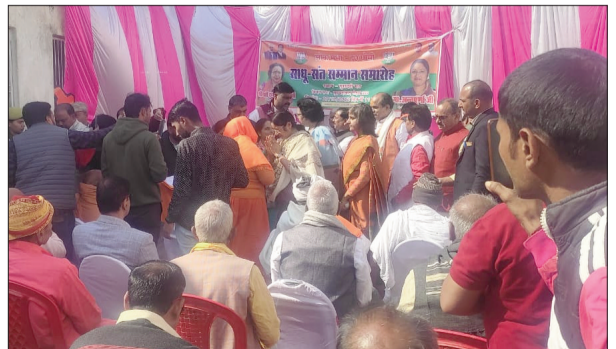
कार्यक्रम में शामिल साधु-संत व अन्य लोग

आस्था और विश्वास के केंद्र बाबा घनश्याम साहब के सुप्रसिद्ध मठ पर भारतीय जनता पार्टी के सौजन्य से क्षेत्र के साधु-संतों का सम्मान समारोह आयोजित किया गया। इस कार्यक्रम की मुख्य अतिथि पिछले तीन दिनों से मऊ जनपद में