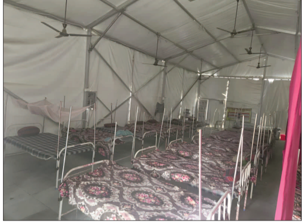
विकास एवं आवास विभाग के प्रधान सचिव से हस्तक्षेप की मांग की है। मामला नगर परिषद डुमरांव की

डुमरांव नगर परिषद पर गंभीर आरोप, बैंक ऋण लेकर कराया था जर्मन हेंगर निर्माण, अब कर्ज और ईएमआई का बड़ा बोझ