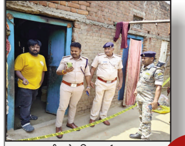
एक कट्टा जमीन के लिए माई बना कातिल बज्रिया में खून से लाल हुई रिस्तों की डोर

प्रमुख खबरें : दिल्ली ■ पटना ■ बक्सर ■ शाहाबाद ■ मगध