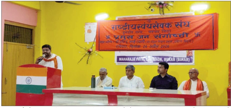
केटी न्यूज/डुमरांव राष्ट्रीय स्वयंसेवक संघ के शताब्दी वर्ष कार्यक्रमों के अंतर्गत रविवार को डुमरांव स्थित अनंतविजयम एकेडमी परिसर में प्रमुख जन गोष्ठी का आयोजन किया