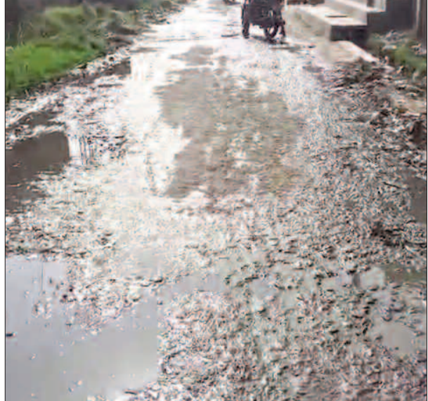
केटी न्यूज/केसठ। प्रखंड के केसठ नया बाजार जाने वाली मुख्य सड़क पर नाली का गंदा पानी बहने से स्थानीय लोगों को भारी परेशानियों का सामना करना पड़ रहा है। उर्दू मध्य विद्यालय से नया बाजार तक जाने वाली यह सड़क दलित बस्ती होकर गुजरती है,

जो इलाके की प्रमुख आवाजाही मार्ग मानी जाती है। नाली की निर्मित सफाई नहीं होने के कारण गंदा पानी सड़क पर फैल गया है, जिससे राहगीरों का चलना मुश्किल हो गया है। खासकर पूजा-अर्चना के लिए जाने वाली महिलाओं, विद्यालय आने-जाने वाले बच्चों और आम लोगों को काफी दिक्कतों का सामना करना पड़ रहा है। सड़क पर जलजमाव और गंदगी के कारण फिसलन की स्थिति बनी रहती है, जिससे दुर्घटना की आशंका भी बढ़ गई है। स्थानीय ग्रामीणों का कहना है कि इस समस्या को लेकर कई बार संबंधित विभाग को जानकारी दी गई, लेकिन अब तक कोई ठोस पहल नहीं की गई है। लोगों ने प्रशासन से जल्द से जल्द नाली की सफाई कराने और समस्या का स्थायी समाधान करने की मांग की है, ताकि आमजन को राहत मिल सके।