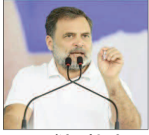
नई दिल्ली