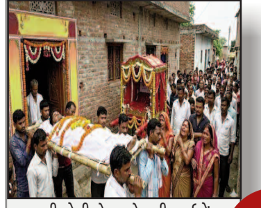
बहन की डोली से पहले उठी माईयों अर्थियां कार्ड बांटने निकले सगे माईयों को ट्रक ने रौंदा