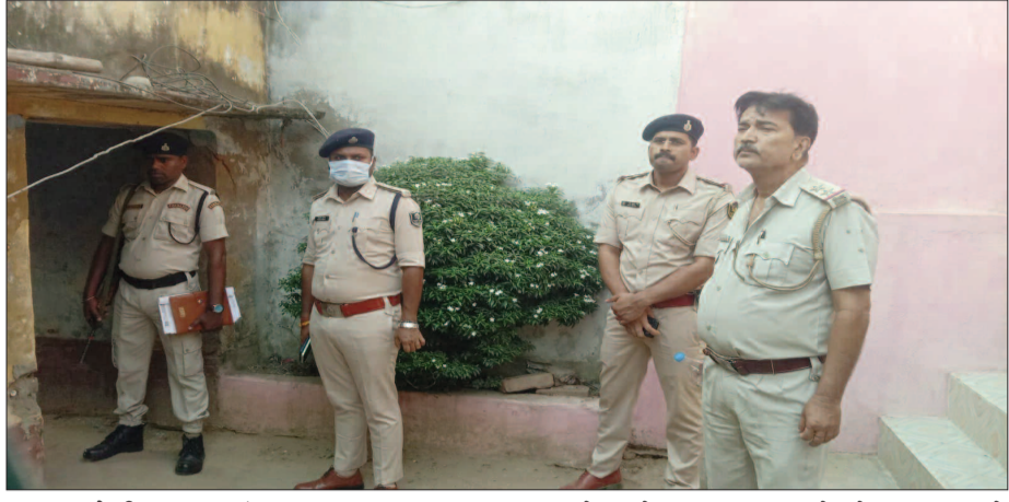
केटी न्यूज/डुमरांव कृष्णाब्रह्म थाना क्षेत्र के अरियांव गांव में संदेहास्पद स्थिति में

“ अरियांव में युवती के शव मिलने की सूचना पर मौके पर पहुंच स्थिति का जायजा लिया गया। घटना स्थल का मां के बयान से स्पष्ट हो रहा है कि युवती मानसिक अवसाद में थी। एसडीपीओ ने कहा कि प्रथम दृष्टया यह आत्महत्या का मामला प्रतीत हो रहा है। जैसे पोस्टमार्टम रिपोर्ट आने के बाद ही इस मामले में कुछ कहा जा सकता है।