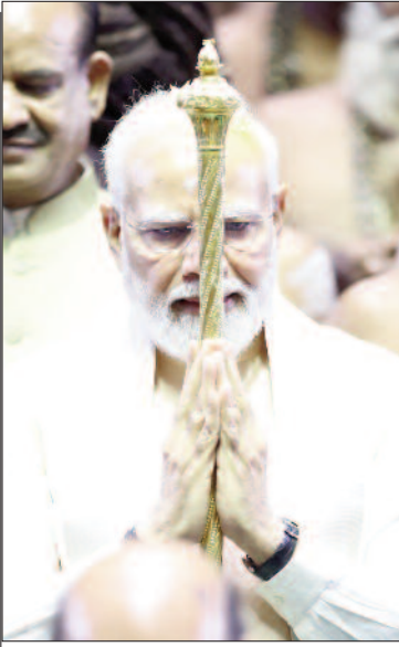
पवित्र सेंगोल को हाथ में पकड़े पीएम मोदी।

देश को नया संसद भवन मिल चुका है। पीएम मोदी ने पूरे विश्व-विधान से इसका उद्घाटन किया। नए भवन में लोकसभा में 888 और राज्यसभा में 384 सदस्यों के बैठने की व्यवस्था है। नई संसद के पहले दिन पीएम मोदी ने मौजूद गणमान्य लोगों को संबोधित किया। पीएम मोदी ने कहा कि हर देश की विकास यात्रा में कुछ फल ऐसे आते हैं, जो हमेशा के लिए अमर हो जाते हैं। कुछ तारीखें समय के ललाट पर इतिहास का अमिट हस्ताक्षर बन जाती हैं। आज 28 मई 2023 का यह दिन ऐसा ही शुभ अवसर है। देश आजादी के 75 वर्ष होने पर अमृत महोत्सव मना रहा है। इस महोत्सव में भारत के लोगों ने अपने लोकतंत्र को संसद के इस नए भवन का उपहार दिया है। उन्होंने कहा कि साधियों ने सिर्फ एक भवन नहीं है। एक राष्ट्र के रूप में हम सभी के लिए 140 करोड़ का संकल्प ही इस संसद की प्राण प्रतिष्ठा है। यहां होने वाला हर निर्णय ही, आने वाले समय को संवारने वाला है। संसद की हर दीवार, इसका कण-कण गरीब के कल्याण के लिए समर्पित है।