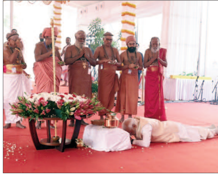
मंत्रोच्चारण के बीच सेंगोल को हाथ में लेने से पहले साष्टांग दंडवत प्रणाम करते पीएम मोदी।

पीएम मोदी ने कहा कि संसद का यह नया भवन, भारत के सृजन का आधार बनेगा। संसद की इस नई इमारत में सेंगोल की स्थापना को लेकर पीएम मोदी ने कहा कि महान चोल साम्राज्य में सेंगोल को कर्तव्य पथ का, सेवा पथ का, राष्ट्रपथ का प्रतीक माना जाता था। राजाजी और आदिमन के संतों के मार्गदर्शन में यही सेंगोल सत्ता के हस्तांतरण का प्रतीक बना था। मोदी ने कहा कि मुझे तमिलनाडु से विशेष तौर पर आए हुए आदिमन के संत ने आशीर्वाद दिया। मैं उन्हें पुनः नमन करता हूँ।