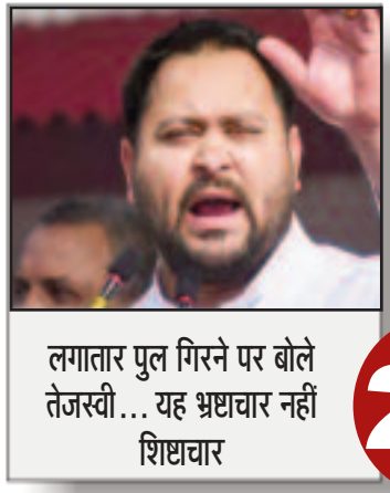
लगातार पुल गिरने पर बोले तेजस्वी... यह भ्रष्टाचार नहीं शिष्टाचार