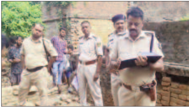
घटनास्थल पर छानबीन करती पुलिस की टीम।

जिला मुख्यालय स्थित नगर थाना क्षेत्र के यमुना चौक के समीप एक खंडहर नुमा मकान से एक युवक का शव पड़ा मिला। इसकी तब जानकारी हुई जब सुबह में सड़क से गुजर रहे लोगों को तेज दुर्गन्ध आई। उन्होंने किसी जानवर के मरने की आशंका पर मकान में प्रवेश किया। जहां उन्हें एक युवक शव पड़ा दिखाई दिया, जिससे दुर्गन्ध आ रही थी। आननफानन में लोगों ने इसकी सूचना पुलिस को दी गई। जहां पुलिस पहुंच कर को कब्जे में ले, पोस्टमार्टम को भेज दिया। वहीं, मामले की तहकीकात की कर रही है। बताया जाता यह खंडहर नुमा मकान नशेड़ियों का अड्डा है। हो सकता है नशे में ही युवक की जान चली गई हो। इधर मृत युवक के परिजनों द्वारा मारपीट कर हत्या करने का आरोप लगाया जा रहा है।