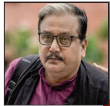
राज्य सभा सांसद मनोज झा के बयान पर बिहार में मचा बवाल