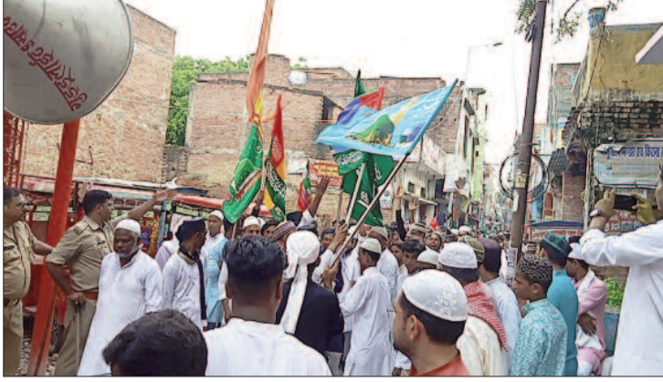
जुलूस निकाला गया जिसमें काफी संख्या में लोगों ने भाग लिया।

जनपद के सिकन्दरपुर में इस्लाम धर्म के प्रवर्तक हजरत मोहम्मद साहब का जन्मदिन ईद मिलादुन्नबी मुस्लिम समुदाय के लोगों ने गुरुवार को हर्षोल्लासपूर्ण वातावरण में अकीदत के साथ मनाई। अक्सर पर मुसलमानों ने प्रातः अपने घरों पर फातेहा कराई और शाम को प्रकाश किया। हजरत मोहम्मद साहब सल्लल. के जन्मदिन पर प्रत्येक वर्षों की भांति इस वर्ष भी नगर में एक