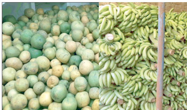
गोदाम में भंडारित किया गया फल