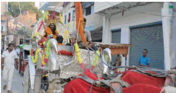
शोभायात्रा में शामिल झांकियां