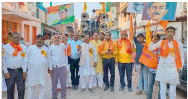
शोभायात्रा में शामिल लोग