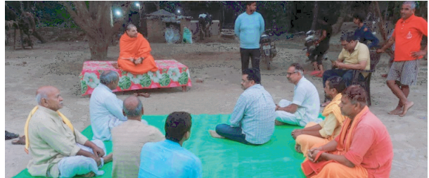
यज्ञ समिति के साथ बैठक करते गंगा पुत्र महाराज