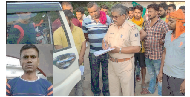
पूजाछ को पहुंची पुलिस व मृतक की फाइल फोटो