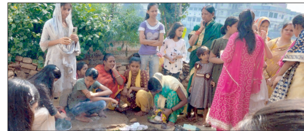
गोबर्द्धन कूटती महिलाएं