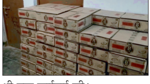
भी उक्त कार्रवाई की।