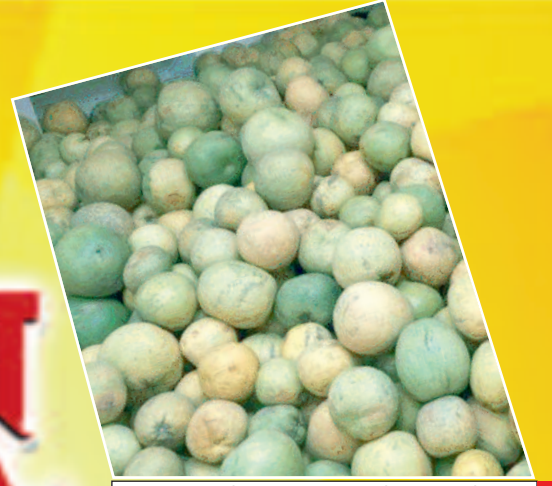
छठ महापर्व को ले आयातित फलों से पटा गोदाम, कई राज्यों से मंगवाए गए हैं फल

प्रमुख खबरें : पटना ■ भोजपुर ■ बक्सर ■ रोहतास ■ पूर्वांचल ■ विविध ■ खेल ■ आर्थिक