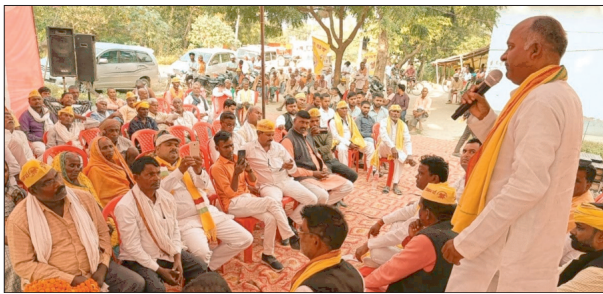
कार्यकर्ताओं को संबोधित करते राष्ट्रीय अध्यक्ष