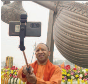
मुख्यमंत्री ने 2 दिसम्बर और 21 दिसंबर को अयोध्या आगमन पर मंदिरों में शोष

पीएम मोदी के आगमन से पहले मुख्यमंत्री योगी आदित्यनाथ ने विकास कार्यों का जायजा लिया। आज उन्होंने हनुमानगढ़ी व रामलला के दर्शन-पूजन किए। संकट मोचन हनुमान व रामलला के दर्शन कर सीएम योगी आदित्यनाथ ने सुखी-स्वस्थ उत्तर प्रदेश की कामना की। इसके पहले रामकथा हेलीपैड पहुंचने पर स्थानीय जनप्रतिनिधियों ने उनका स्वागत किया। इस माह में मुख्यमंत्री का तीसरी बार अयोध्या आगमन हुआ है। इससे पहले