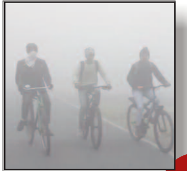
शीतलहर का सितम शुरू, नहीं हुए सूर्य के दर्शन, बढ़ी कनकनी