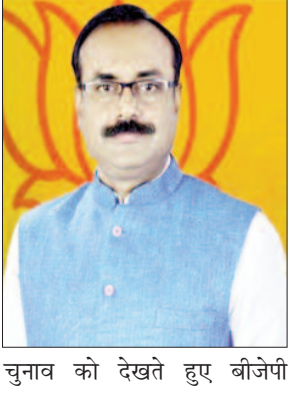
चुनाव को देखते हुए बीजेपी

हाईकमान इस बार सांगठनिक स्तर पर बड़ा बदलाव करने की तैयारी में है। प्रदेश अध्यक्ष की कमान किसके हाथ होगी, इसका अभी कोई खुलासा तो नहीं हुआ है, लेकिन ऐसा माना जा रहा है कि इसमें सामाजिक और क्षेत्रीय समीकरणों को ध्यान में रखते हुए किसी ऐसे नेता को चुना जाएगा जो मुखर होने के साथ-साथ संसद के नई शक्ति प्रदान करे।