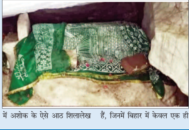
में अशोक के ऐसे आठ शिलालेख हैं, जिनमें बिहार में केवल एक ही

केटी न्यूज/पटना विरासत को सहेजने के बजाय उसका अपमान और खिलवाड़ करने से जुड़ा एक मामला सामने आया है। दरअसल, रोहतास की चंदन पहाड़ी में स्थित महान मौर्य सम्राट अशोक के एक ऐतिहासिक शिलालेख पर मजार बना दिया गया है। मजेदार बात यह है कि इस शिलालेख पर चूने से पोताई करवा कर यहाँ अब चादर चढ़ाई जाती है। ज्ञात हो कि पूरे देश