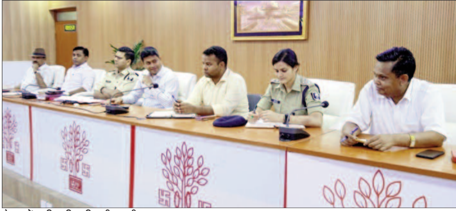
बैठक में शामिल जिलाधिकारी, एसपी व अन्य